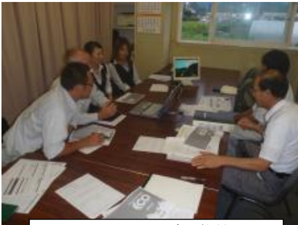
エコドライブの学習

エコドライブ講習会に参加してエコドライブの手法を学んだり、社内でエコドライブの実践ビデオを見たりして、エコドライブを推進しています。