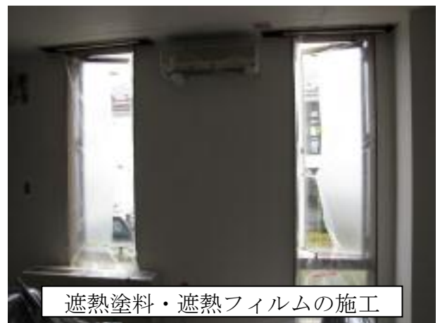
遮熱塗料・遮熱フィルムの施工

社内で、エコドライブ学習を各部門毎に行い、エコドライブを意識した運転を心がけるような取組を実施しています。